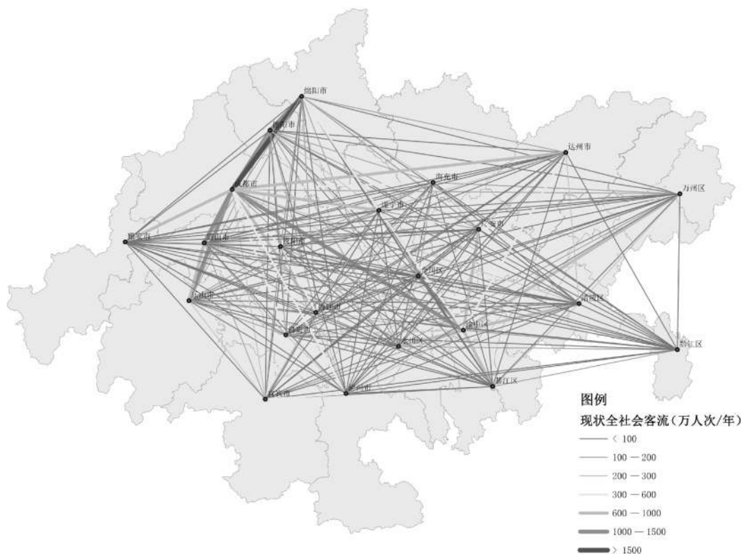
图2 2017年成渝地区双城经济圈联系强度示意图

中心展开。从客流来看，以成渝、成德绵眉乐、成都—达州和重庆—万州等联系最为密切。2017年成渝之间联系强度高达1460万人次/年(见图2)，高于距离相当的济南—青岛之间1350万人次/年的联系强度，达到上海和南京间联系强度的一半。值得注意的是，距离成渝“双核”更近的成渝中部地区，与成渝“双核”之间的联系强度并不高，大多保持在500万人次/年以下，进一步印证了成渝中部地区的“塌陷”短板。